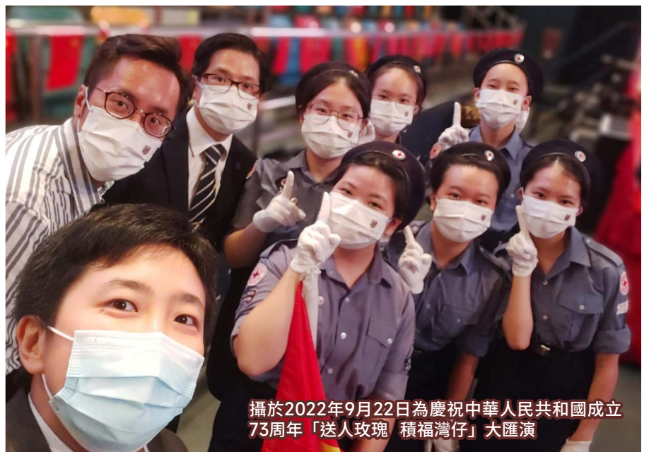
攝於2022年9月22日為慶祝中華人民共和國成立73周年「送人玫瑰 積福灣仔」大匯演

疫情已經肆虐兩年多，從起初的措手不及，到如今看到同學能懷着正面的態度，從容面對一切逆境，並把握時間與同儕相聚，課餘到操場切磋球技，參加各項課外活動，建立友誼，也讓我深感欣慰。在未來的日子裏，我相信聖方濟各的學生也能保持樂觀的心態，懷抱感恩、尊重與承諾，乘風破浪，揚帆起航，活出精彩、美滿的人生。天主保佑！